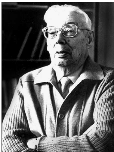
Фото 3 Академик М. А. Садовский (1984 г.)

На фото 4 (1946 г.) — сотрудники лаборатории взрывных процессов, которой руководил Беляев.