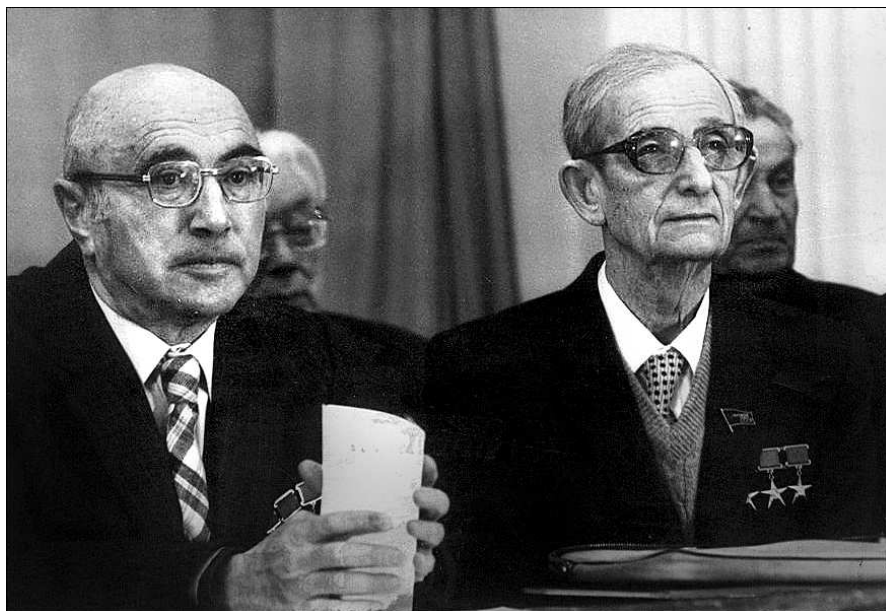
Фото 2 Академики Я. Б. Зельдович и Ю. Б. Харитон (1984 г.)

На фото 2 и 3 показаны близкие А. Ф. Беляеву люди. На них — всем известные выдающиеся ученые: Юлий Борисович Харитон, который был руководителем Беляева в течение всей его жизни; Яков Борисович Зельдович, с которым он много работал в области горения, что привело, в частности, к созданию получившей мировое признание теории горения летучих ВВ — теории Зельдовича–Беляева; Михаил Александрович Садовский — крупнейший специалист в области физики и геофизики взрыва, которого с Беляевым связывали не только совместные исследования по работе взрыва, но и большая личная дружба.